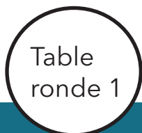
Table ronde 1